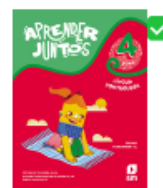
Aprender Juntos Português 4º Ano

Obs.: Os materiais didáticos também poderão ser adquiridos nas livrarias ou sites de compra por preço comercial.