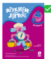
Aprender Juntos Geografia 4º Ano