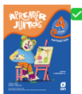
Aprender Juntos Matemática 4º Ano