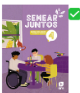
Semear Juntos Ensino Religioso 4º Ano